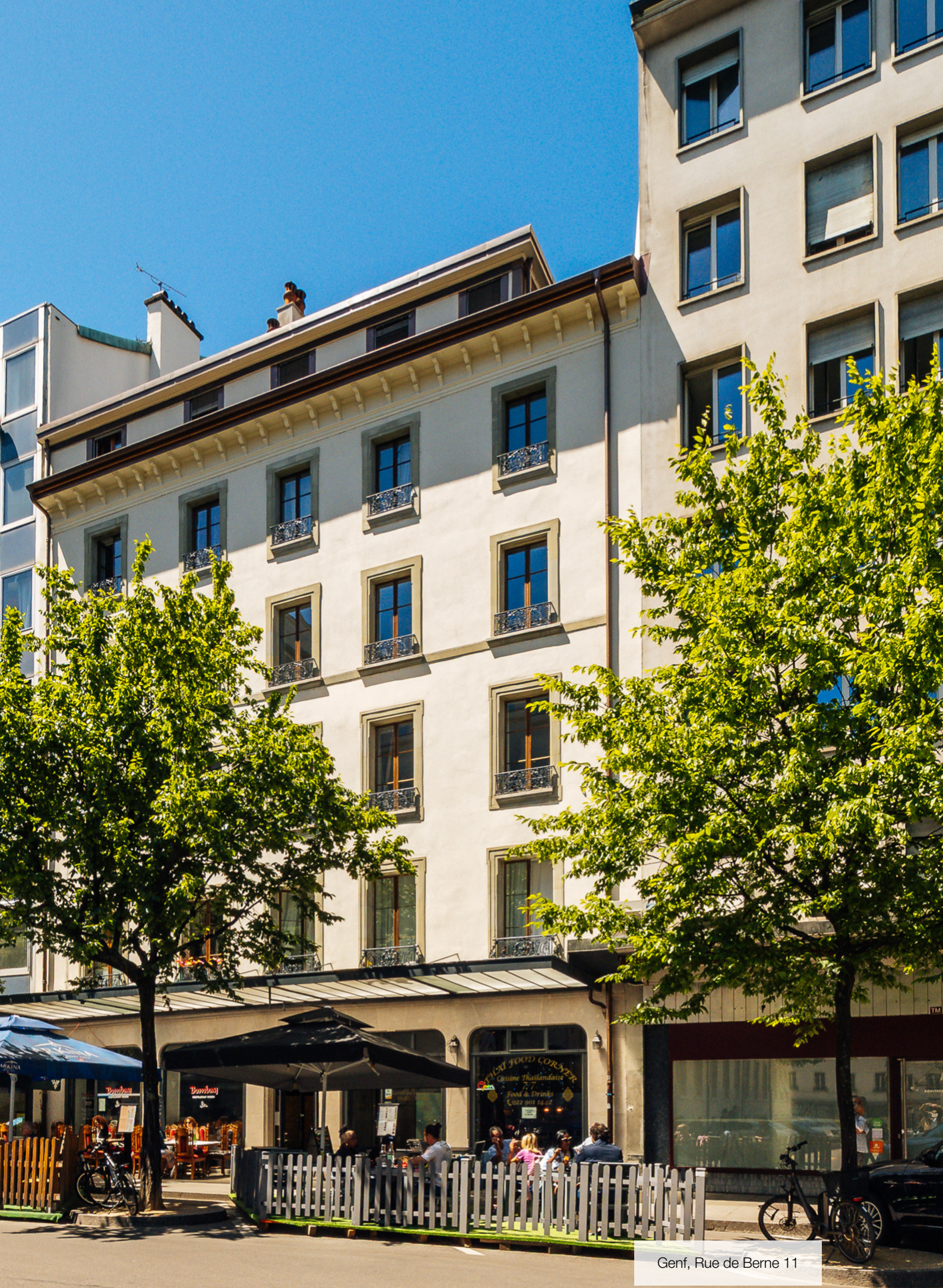
Genf, Rue de Berne 11