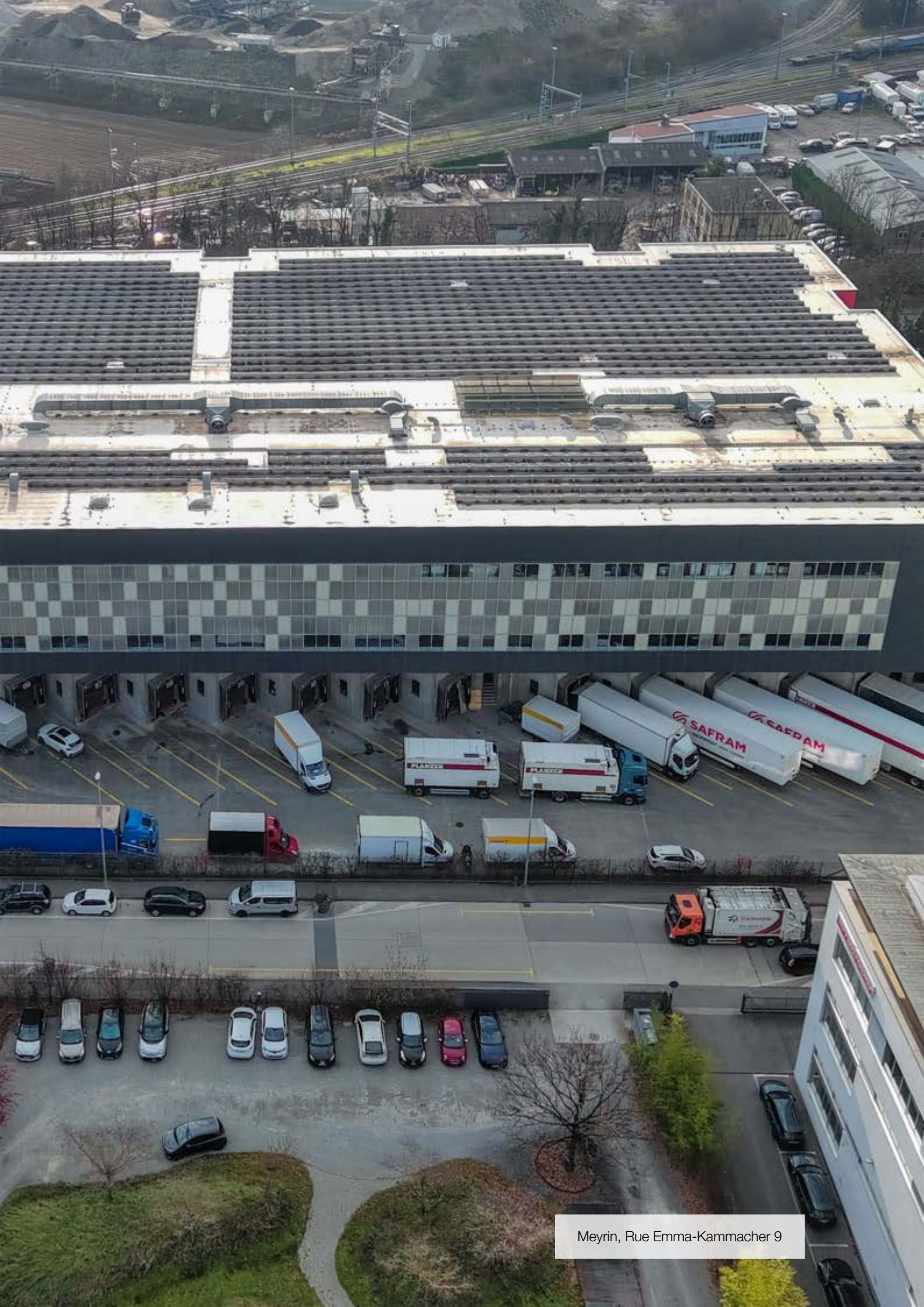
Meyrin, Rue Emma-Kammacher 9