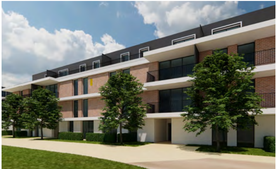
Route d'Annecy 281 à La Croix-de-Rozon (GE)

Das Projekt stellt ein Gesamtinvestitionsvolumen von rund CHF 58 Millionen dar, mit einer Bruttorendite von knapp 4% und einer geplanten Fertigstellung im ersten Quartal 2027.